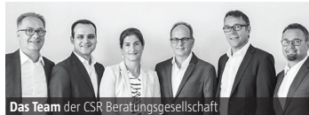
Das Team der CSR Beratungsgesellschaft

Alle Titel im Portfolio müssen vor der Investition einen Nachhaltigkeitsfilter durchlaufen, der von der Ratingagentur